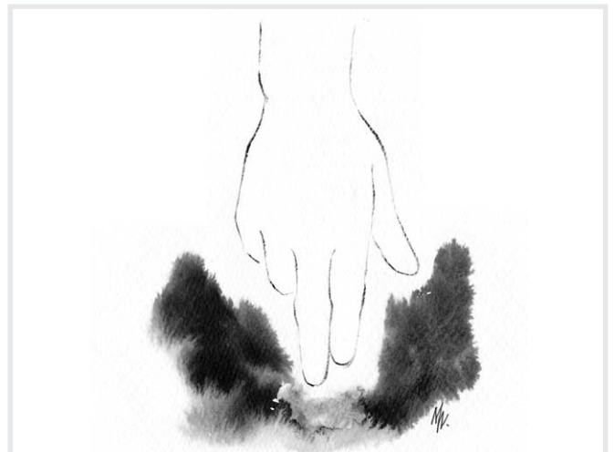
그에게 “에파타!” 곧 “열려라!”하고 말씀하셨다(마르 7, 34).

“나의 사랑 안에서 너의 닫힌 귀를 열어 내 말을 들어라! 그리고 묶인 혀를 풀어 진리를 선포해라!”