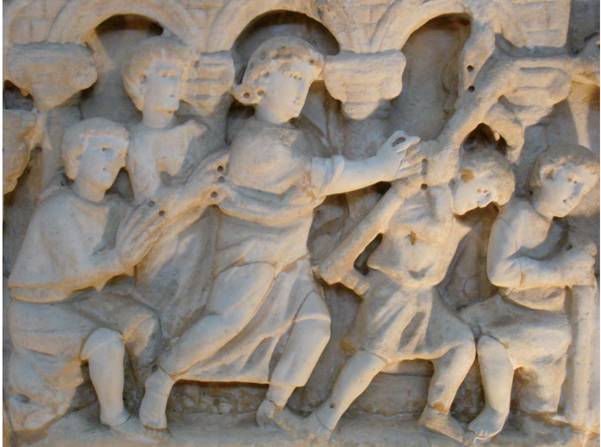
〈병자를 고쳐주시는 예수님〉(부분), 375년-400년 경, 대리석, 성비오크리스찬갤러리, 바티칸 박물관