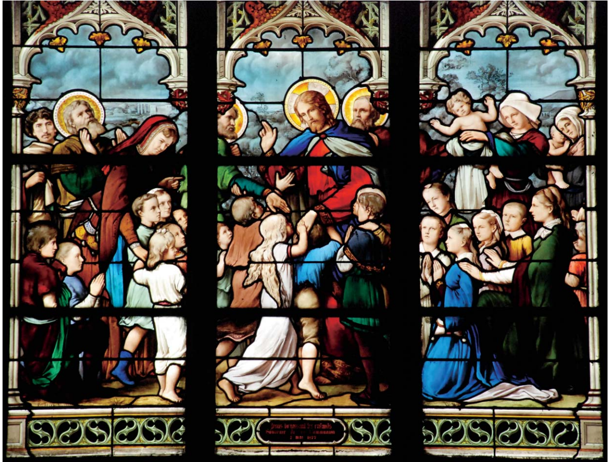
〈어린이들을 사랑하시는 예수님〉, 1877년, 유리화, 생 세브랭성당, 파리, 프랑스